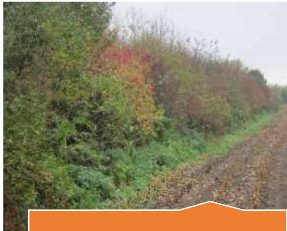
Circa 2.000 m aan struweelsingels