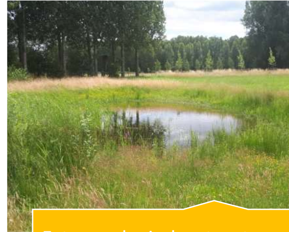
Extra ecologische stapsteen 1 hectare