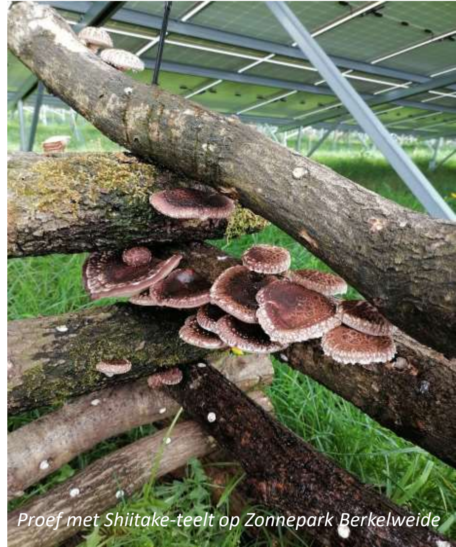
Proef met Shiitake-teelt op Zonnepark Berkelweide