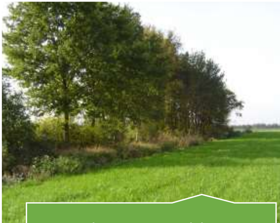
Corridor groot wild ca. 20 meter breed